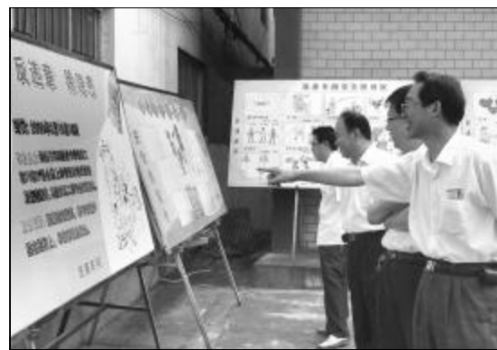
安全月活动期间，分厂以“治理隐患，防范事故”为主题，组织各车间举行安全漫画展。图为分厂员工正在观看图文并茂的安全漫画。

本着“不留死角，严格控制，注重实效”的要求，车间制定了《员工现场管理四项权利》，即班前会不讲安全，工人有权拒绝接班；干部违章指挥，工人有权拒绝操作；安全设施不完善，工人有权不进入现场；安全设施没有保障，工人