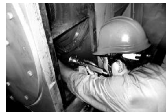
由于夏季温度高,对电机的碳刷影响很大,磨损老化频繁,增加电机的电能消耗。近日,氧化铝三分厂检修车间电工班对磨损、老化的碳刷进行全部更换。图为电工人员在更换荷兰泵碳刷。