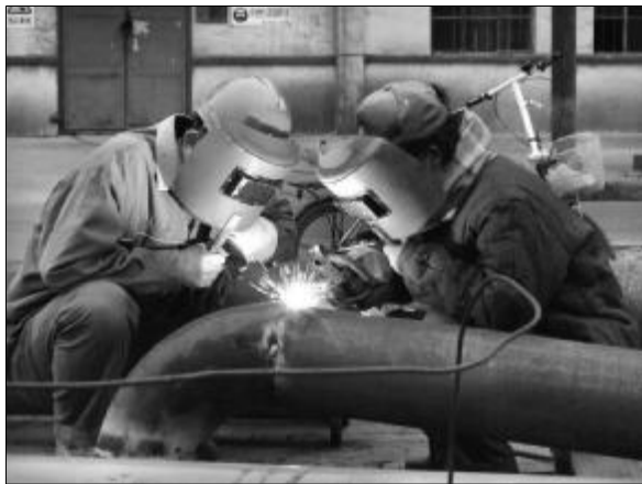
为顺利完成山西分公司生产系统2009年安全隐患治理项目,近日,氧化铝四分厂将所承担的任务分散在6个作业点,检修人员克服诸多困难,认真完成管道除锈、焊接、吊运、打压、安装等任务。图为员工对管道接口进行仔细焊接。

★2月24日,氧化铝三分厂开展了安全隐患大检查,对查出的26项隐患要求立即整改,为实施023方案做好积极的准备。(樊海啸、杨国强)