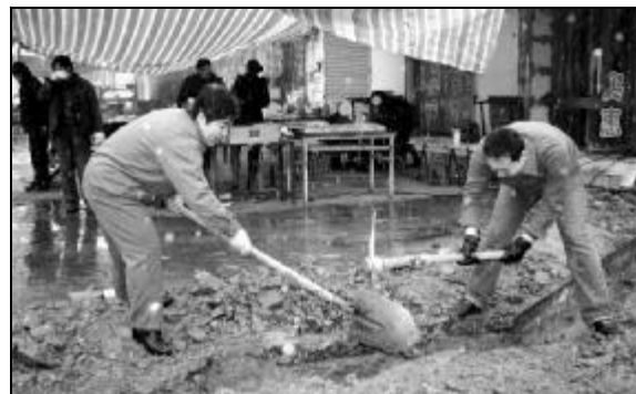
加班加点保供电。2月26日,西旺物业部维修中心员工冒着雨雪加班清理电缆沟、铺设电缆线、连接线路,确保朝霞北小区市场尽快恢复正常供电。图为员工冒着雨雪清理电缆沟淤泥。

预防“上感”措施:①加强身体锻炼,增加户外活动,增强机体抵抗能力。②讲究卫生,合理护理,根据天气变化适当增减衣服;居室要定期通风换气,室温勿过高或过低,并保持一定湿度。③尽可能不去公共场所,以防交叉感染。④应用疫苗预防:从鼻腔内喷入或滴入减毒疫苗,可以预防或减轻“上感”病症。⑤室内定期用食醋熏蒸,在疾病流行期可用0.5%病毒唑滴鼻或用板蓝根、双花、菊花等煎服或代茶饮。