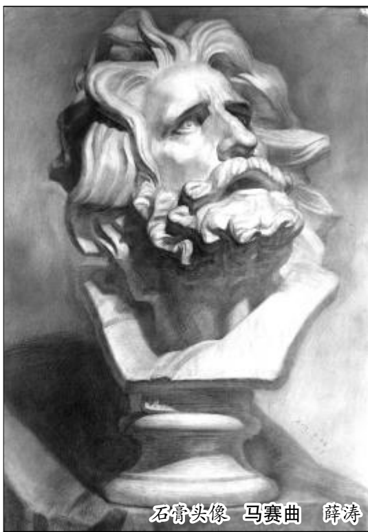
石膏头像 马赛曲 薛涛