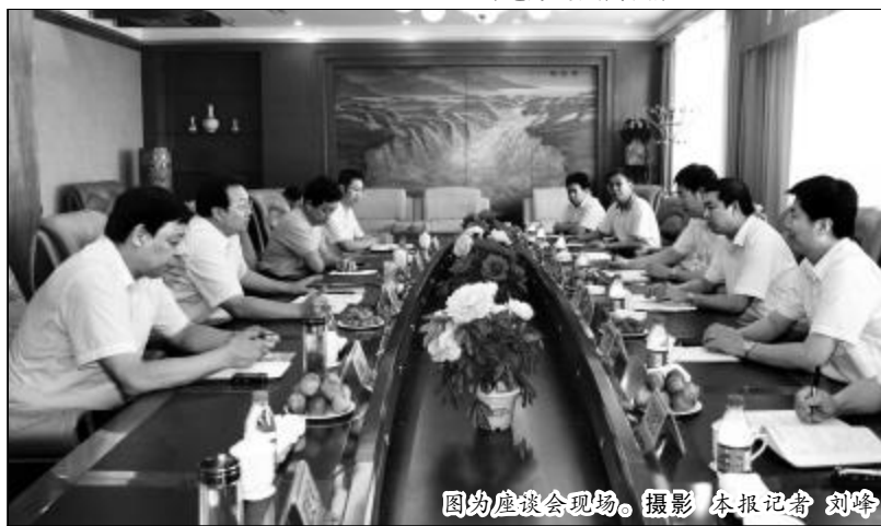
图为座谈会现场。