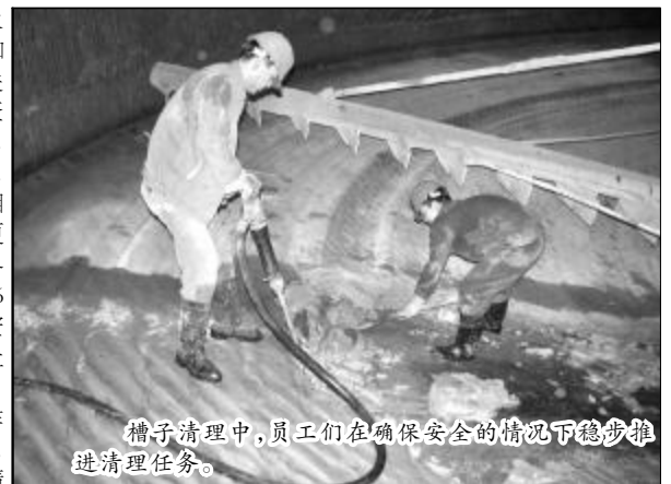
槽子清理中,员工们在确保安全的情况下稳步推进清理任务。

在企业多年生产中,事故的发生90%以上出自于人为习惯性违章,而习惯性违章的难以制止,关键在于作业人员并未视为违章的习惯性,而这种可怕的习惯性,又在于主观能动性为主体支配着物、机的人的行为,换句话说人作为生产的动因和主因,不仅是生产的主宰者,也是无意识中的破坏者。第一氧化铝厂找准隐患顽症,结合企业安全工作安排,深入开展反习惯性违章活动,对操