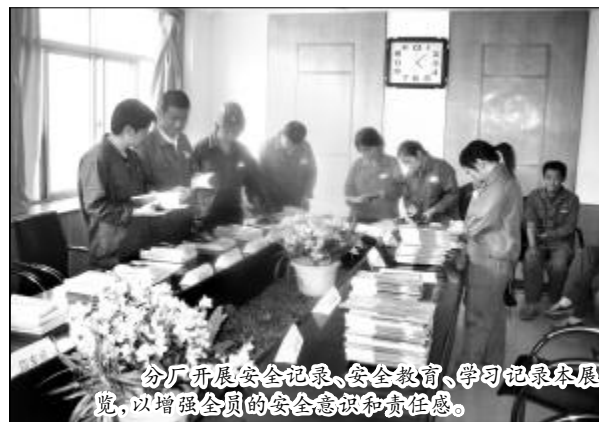
分厂开展安全记录、安全教育、学习记录本展览,以增强全员的安全意识和责任感。

如果说管理是企业的命脉,安全管理则是企业生产的保障。第一氧化铝厂成立之初,结合新体制完善各项管理,以动静结合创新