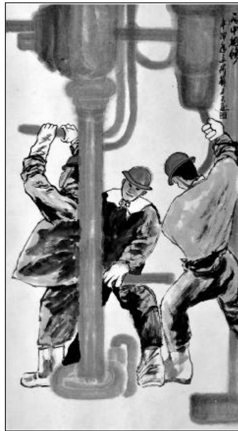
雨中检修 国画 薛国刚

岁月更迭。如今，渡口上大片的芦苇因为地方建设需要，大片芦苇被烧毁铲平，现存的芦苇从稀稀落落地站立在渡口两旁，仿佛失去了家园的孩子，摇晃着脑袋，在阵阵晚风中四处张望。时过境迁，记忆中的河渡依旧飘荡着大片芦苇，只是芦哨流出的美妙的曲调早已在风中飘远。如今，我坐在窗前，目光投向窗外，想昔日成长的印记，现今又该到哪里找寻？