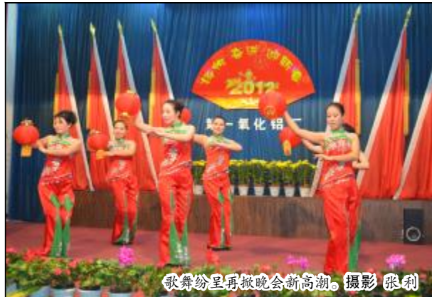
歌舞纷呈再掀晚会新高潮。

红旗”等荣誉的集体、优秀班组长、岗位操作能手明星员工颁发了荣誉证书和锦旗。在表彰会后的新年晚会上，