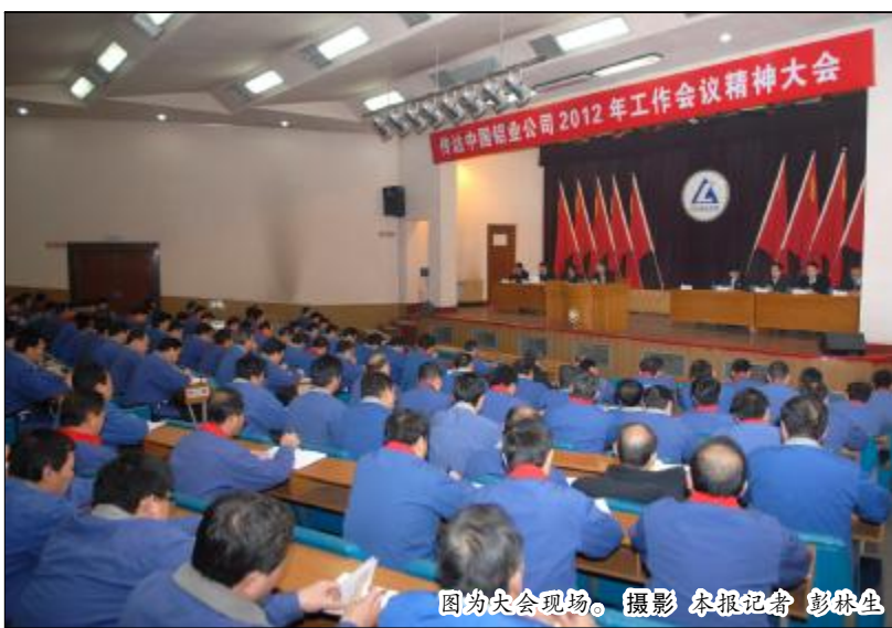
图为大会现场。

本报讯(记者 芦莲莲)2011年12月31日下午,中铝山西企业在山西分公司会议厅召开会议,传达中铝公司2012年工作会议、党风和反腐倡廉工作会议、信息化工作会议、第三次科技大会精神。山西铝厂厂长、山西分公司总经理冷正旭,山西铝厂党委书记郭顺喜,山西分公司副总经理裴卫东、张占明、王天庆,山西铝厂党委副书记、纪委书记、工会主席韩俊科,山西分公司财务总监张士国,企业助理级领导和中层干部,主任工程师、主管工程师参加了会议。郭顺喜主持会议。