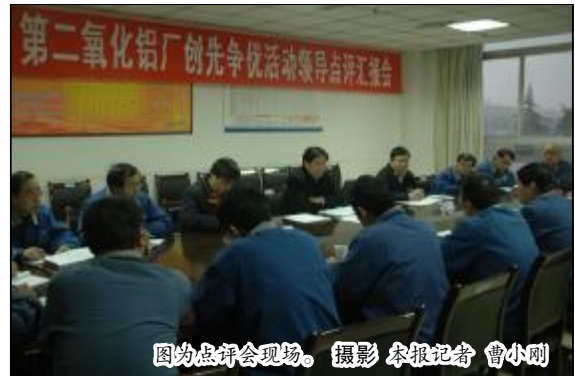
图为点评会现场。

元旦前夕举办“迎新年环厂跑”活动是中铝山西企业长期坚持的一项传统体育项目,至今已连续举办了28届。此项活动的举办,是对企业干部员工精神风貌的集中展示,是对大家身体素质、意志和耐力的综合检验,也是增强企业凝聚力、向心力的有效载体。