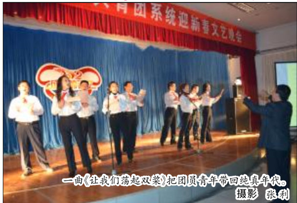
一曲《让我们荡起双桨》把团员青年带回纯真年代。

本报讯 2011年12月28日晚，山西铝厂团委举办“成长的记忆”晋铝青年迎新年文艺晚会，百余名团员青年代表欢聚一堂，喜迎新年。