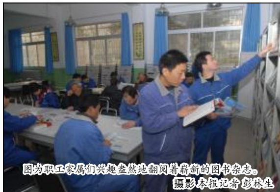
图为职工家属们兴趣盎然地翻阅着崭新的图书杂志。

级改造,更新了图书刊物展示柜,使书屋总面积达300余平方米,藏书量达1.5万余册、报纸60余种、电子音像制品80余种、刊物杂志120余种。同时增加了宽带网络系统、电子化图书借阅管理系统,不仅为广大职工和家属学习阅读提供了舒适环境,而且把职工书屋打造成为企业社会主义精神文明建设的重要阵地。