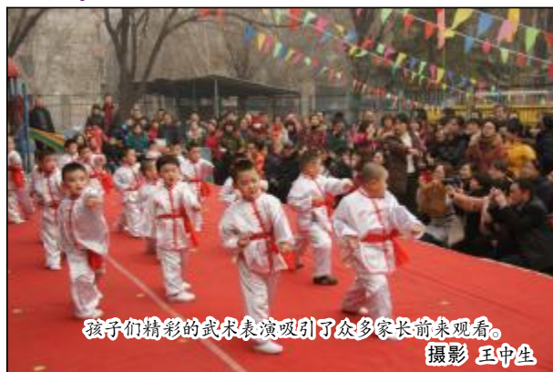
孩子们精彩的武术表演吸引了众多家长前来观看。

太华幼儿园孩子们制作了手工、毓秀幼儿园孩子表演了精彩的武术和舞蹈、朝霞第一幼儿园组织美术现场表演、曙光幼儿园美丽的园内装饰、朝霞第二幼儿园丰富的班级活动，让家长和小朋友们忘却了冬日的严寒，沉浸在浓浓的节日气氛里。(侯金翎)