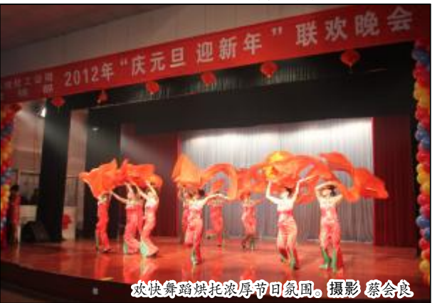
欢快舞蹈烘托浓厚节日氛围。

《和谐大家庭》、《谱写新篇章 再创佳绩》、《阳光总在风雨后》……振奋人心的歌曲和贴近生活的情景剧展现了科技化人在2011年取得的优异成绩，唱响了科技化人2012年开拓创新、再创佳绩的前进音符。