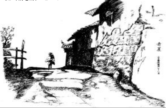
老屋(钢笔画) 张云洁